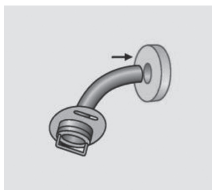
Abbildung 1 Aufsetzen des BMV® Kanülendichtring Foam auf die Trachealkanüle

ACHTUNG! Bitte beachten Sie beim Einsetzen der Trachealkanüle die Anwendungshinweise des Trachealkanülenherstellers!